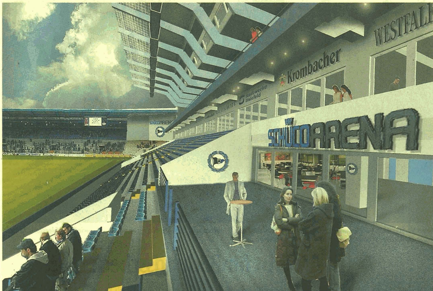
Die neue Haupttribüne: Über 6.700 Zuschauer sollen dort Platz finden. Integriert wird ein Business-Bereich mit Business-Terrasse (rechts). Das Dach soll etwa zur Hälfte aus Glas bestehen und mit Photovoltaik-Anlagen ausgestattet werden. Die Gästefans finden in der Ecke zwischen neuer Tribüne und Nordtribüne in Zukunft 1.400 Stehplätze (hinten). Insgesamt wird das Stadion nach dem Umbau 28.344 Plätze aufweisen.